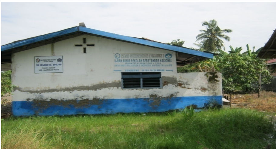
Gambar 1. Kondisi Sarana Pendidikan Di Desa Paluh Manan

Berdasarkan data yang diperoleh, masyarakat desa ini adalah masyarakat pra sejahtera dengan tingkat pendidikan masyarakat yang rendah. Hal ini adalah juga termasuk faktor utama dari munculnya permasalahan sosial yang terjadi di Desa Paluh Manan Kecamatan Hamparan Perak.