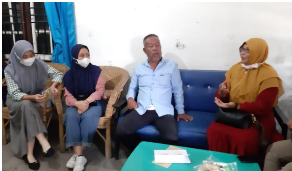
GAMBAR 2.1 Mengantarkan surat izin untuk bekerja sama ke mitra Bahbutong.