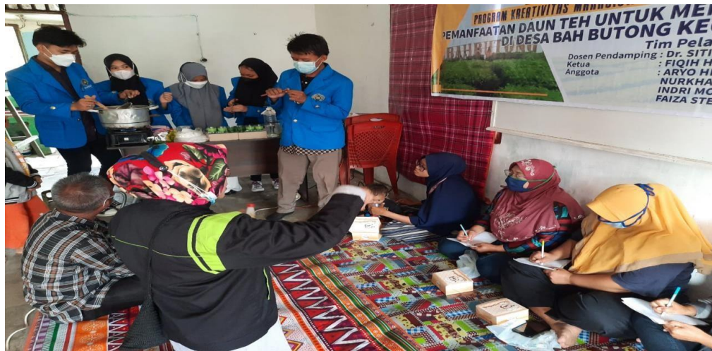
GAMBAR 2.5 Pelaksanaan kegiatan penyuluhan pemanfaatan daun teh kepada mitra