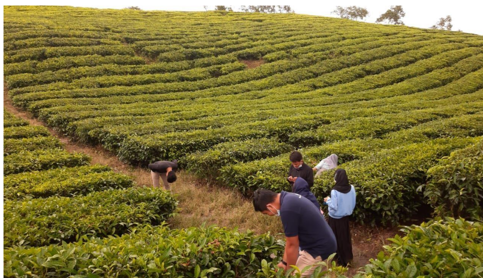
GAMBAR 2.2 Survei lokasi tempat pelaksanaan PKM PM