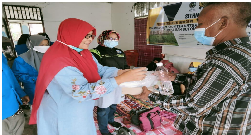
GAMBAR 2.6 Penyerahan sebagian bahan pembuatan produk lilin aromaterapi kepada mitra.