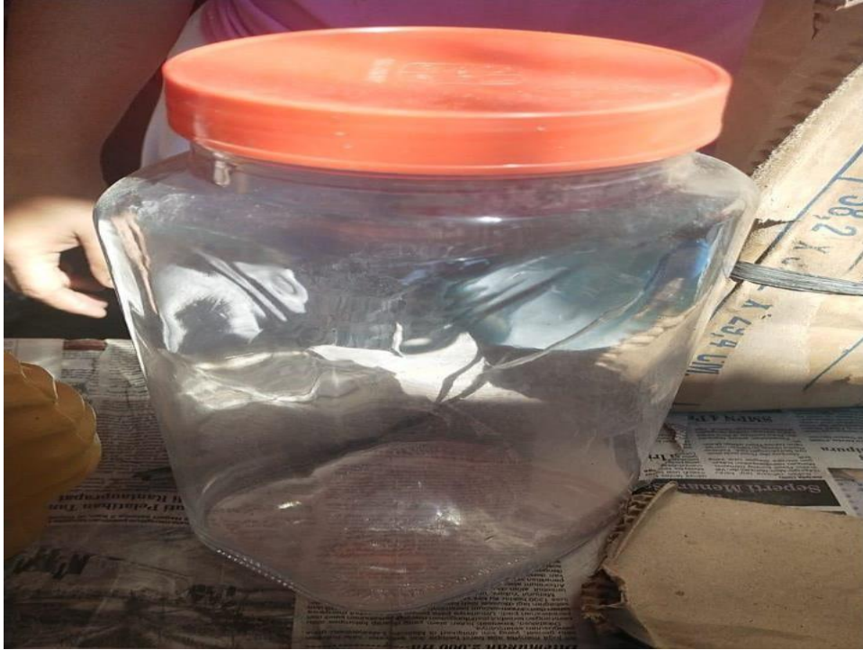
GAMBAR 3.7 Toples Kaca