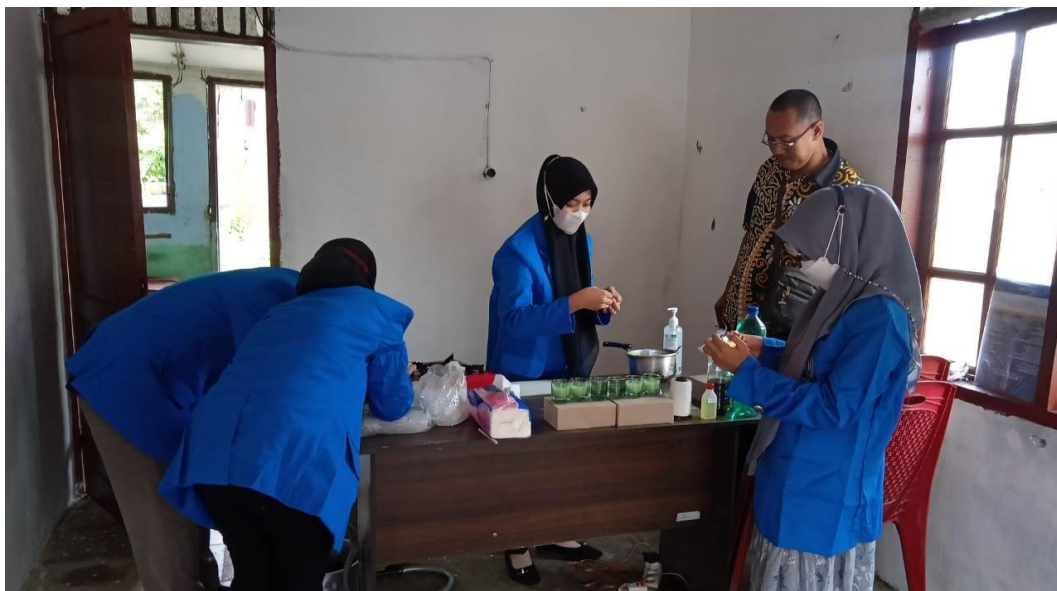
GAMBAR 2.4 Persiapan (Sentralisasi tempat, penempatan alat dan bahan)