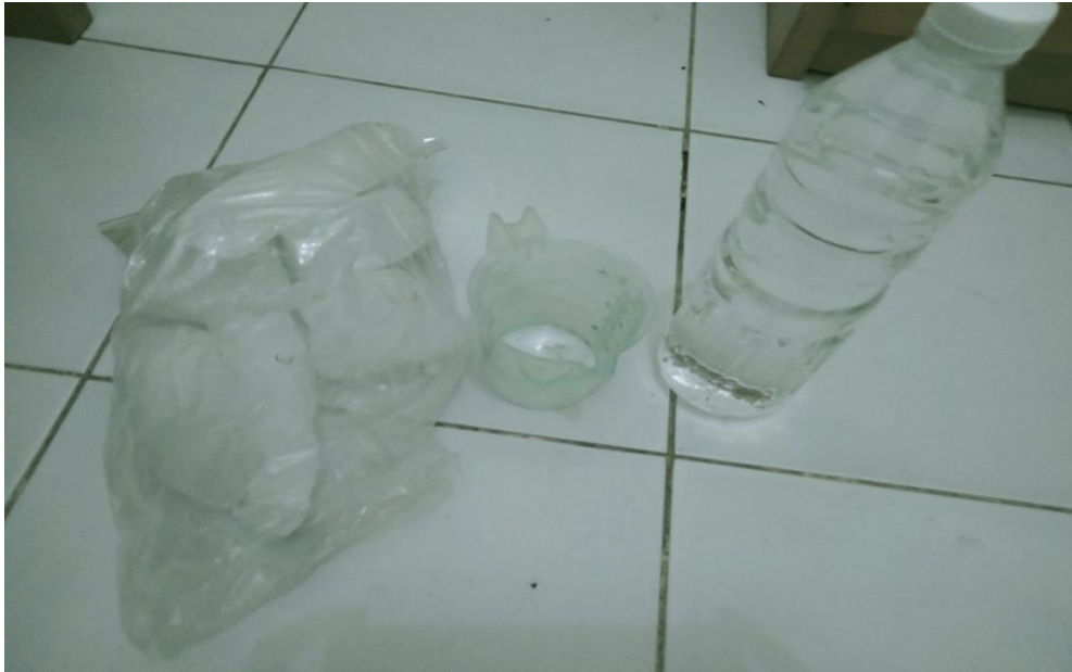
GAMBAR 3.1 Farapin, gelas ukur, dan alkohol.