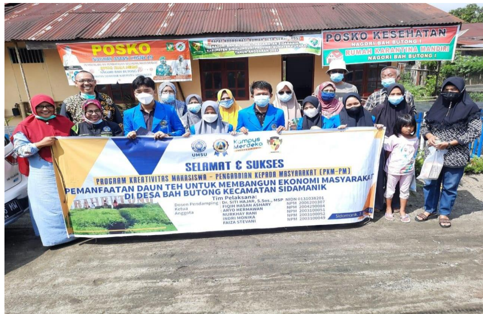
GAMBAR 2.7 Evaluasi