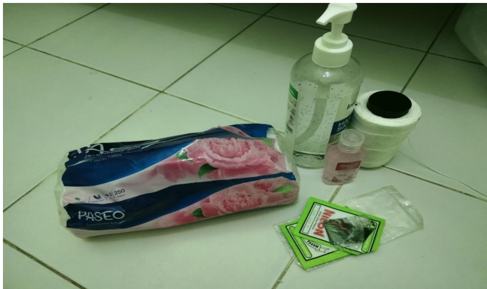
GAMBAR 3.2 Tissue, hand sanitizer, benang nilon, dan pewarna hijau.