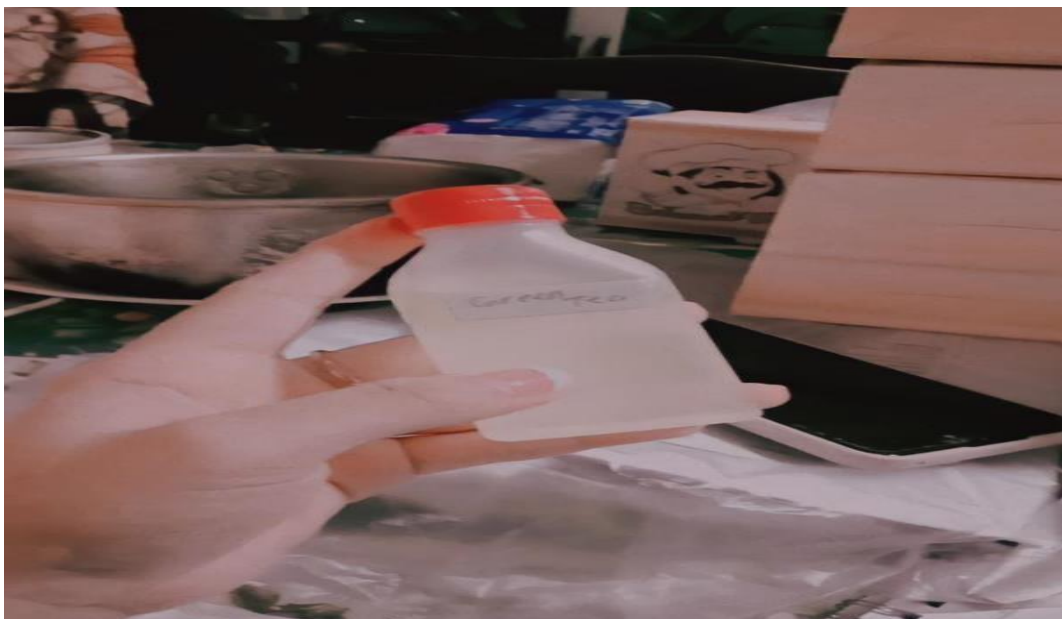
GAMBAR 3.6 Esensial oil