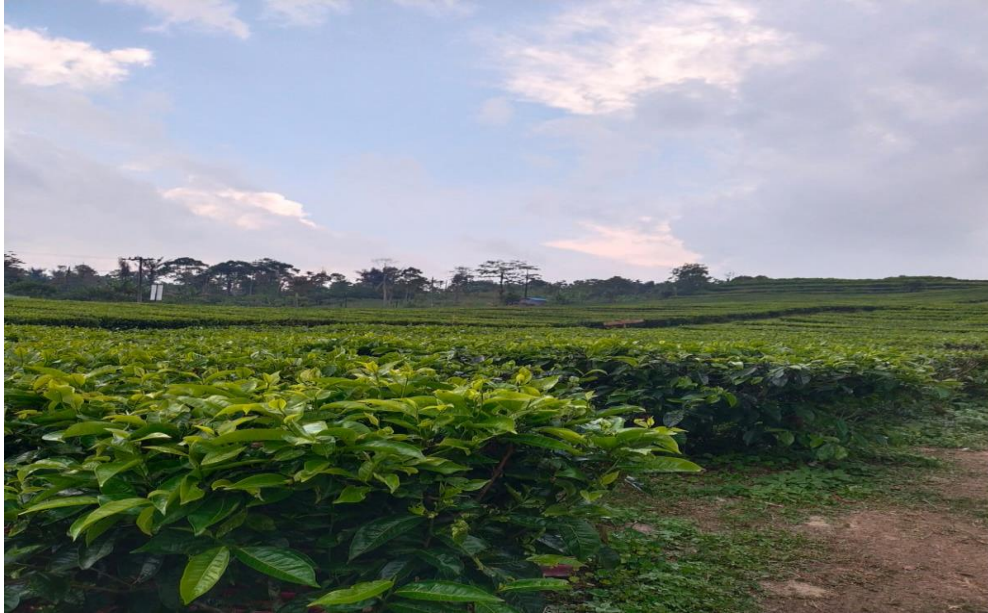
Gambar 1.1 Perkebunan teh Desa Bahbutong.

yang tidak di pergunakan. Serta penyampaian kepada masyarakat agar daun teh dimanfaatkan lebih banyak lagi, hal seperti ini akan mengurangi terbuangnya daun teh yang tidak bisa dipergunakan lagi demi membantu meningkatkan penghasilan masyarakat desa.