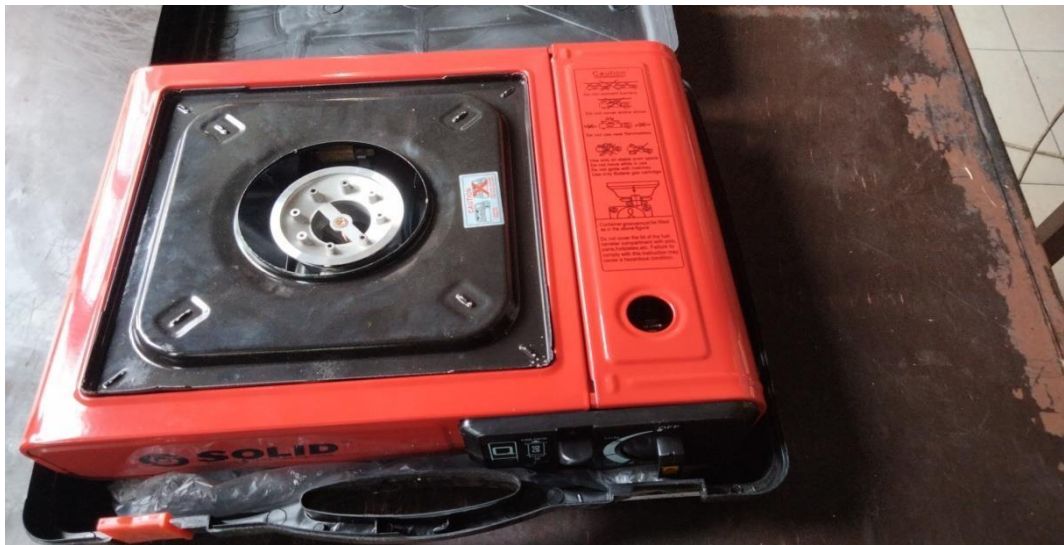
GAMBAR 3.4 Kompor portabel