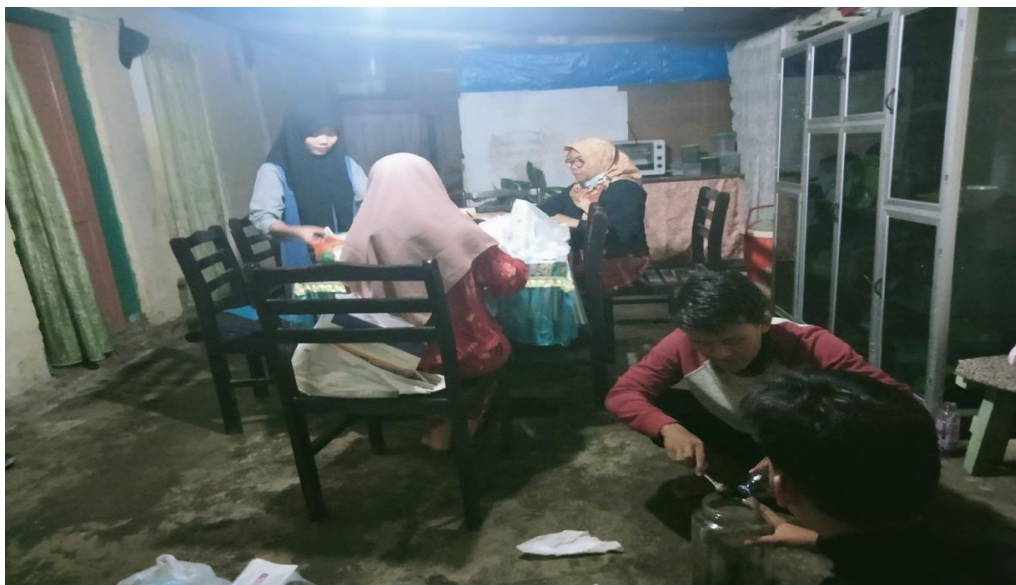
GAMBAR 2.3 Pemeriksaan alat dan bahan