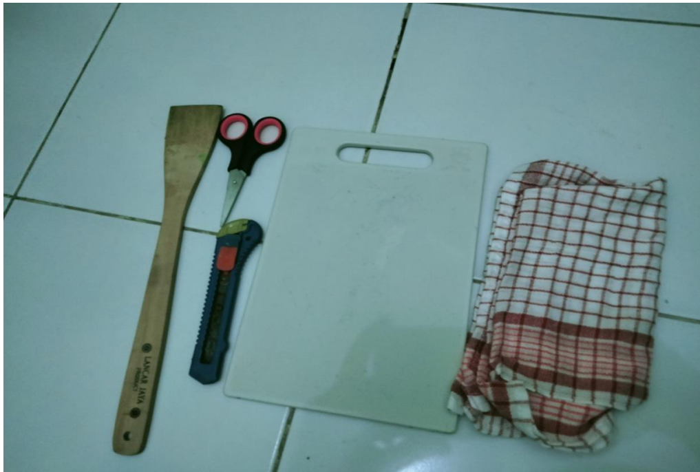
GAMBAR 3.3 Sendok kayu pengaduk, gunting, pisau, telenan, dan serbet.