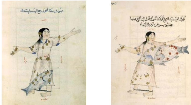
Gambar 1. Ilustrasi Konstelasi Andromeda pada kitab Al Sufi yang di Orientalisasi dengan Pengaruh Tradisi Anwa'

Seiring berkembangnya teknologi maka pengetahuan yang dituliskan oleh ilmuwan terdahulu juga dapat dinaikkan kualitasnya. Dalam buku karya Al-sufi, data bintang dan konstelasi masih hanya dapat dibaca dan dipahami oleh orang yang memiliki pengetahuan lebih jauh untuk astronomi, namun sulit diterima oleh kalangan pemula. Sehingga untuk mengenalkan dan menyebarkan pengetahuan lama terhadap konstelasi ini juga dapat dipublikasi secara digital bahkan dapat dimasukkan ke dalam aplikasi/perangkat lunak yang dapat menggambarkan lebih baik terhadap posisi bintang dan gambaran konstelasi itu di langit.