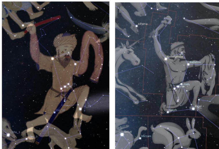
Gambar 4. Perbandingan Ilustrasi Konstelasi Orion Pada Stellarium berdasarkan: Al-Sufi (kiri), Ptolemy (kanan)

Perbandingan ilustrasi Konstelasi Orion pada kebudayaan Arab dari kitab Al-Sufi dan Konstelasi dari peradaban Barat dari buku Almagest yang telah direvisi pada software Stellarium yang menunjukkan beberapa perbedaan bintang konstelasinya ditunjukkan pada gambar 4.