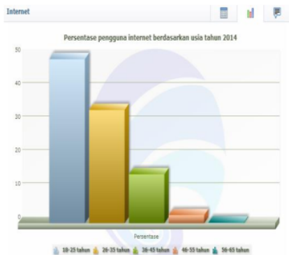
Gambar 1: Persentase Penggunaan Internet Berdasarkan Usia Pada Tahun 2014

Oleh karenanya penting bagi para pengguna internet dan media sosial untuk bisa menggunakan akun media sosialnya secara cerdas sehingga tidak tersangkut pada jeratan hukum pidana sebagaimana yang diatur dalam UU No. 11 Tahun 2008 tentang Informasi dan Transaksi Elektronik. Apalagi data yang dikeluarkan oleh Kemenko Info menunjukkan 50 persen pengguna internet di Indonesia berada dikisaran umur 18 s/d 25 tahun dan sekitar 33 persen pengguna internet di Indonesia berada pada usia 26 s/d 35 tahun (lihat gambar.1).