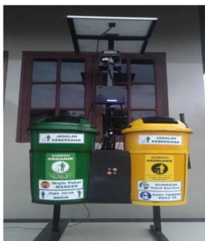
Gambar 1. Rancangan System PLTS Otomatis Menggunakan Energi Matahari

UMSU, yang bertempat di jalan Kapten Muchtar Basri No.3, Glugur Darat II, Kec. Medan Tim., Kota Medan, Sumatera Utara 20238. Adapun langkah-langkah yang harus diketahui dalam melaksanakan tugas akhir ini antara lain, Menentukan tema dengan cara melakukan studi literature guna memperoleh berbagai teori dan konsep untuk mendukung penelitian yang akan dilaksanakan, Menyiapkan alat dan bahan penelitian, Melakukan penelitian pengontrolan dan analisis solar sel sebagai sumber energi pada tempat sampah pintar berbasis mikrokontroler arduino uno, Mengumpulkan data dari hasil penelitian, Mengelola data hasil penelitian, Melakukan analisa pada hasil penelitian. Berikut gambar rancangan system PLTS otomatis menggunakan energi matahari.