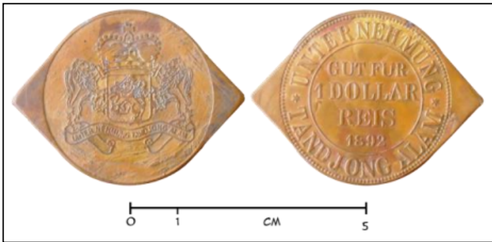
Gambar 5.6: Contoh uang kebon 6 (Churmatin Nasoichah, 2010)

Uang ini berbentuk oval berukuran uang ini panjang 5,3 cm, diameter pendek 3,4 cm, dan tebal 0,2 cm. Uang ini merupakan koleksi Museum Negeri Prov. Sumatera Utara dengan nomor inventaris 3460. Uang ini berbahan perunggu, dan memiliki dua sisi yang bergambar. Pada satu sisi bergambar hanya satu sisi yang memiliki tulisan berupa aksara latin yang berbunyi “Unternehmung Gut Für 1 Dollar Reis 1891 Soengei Serbangan”.