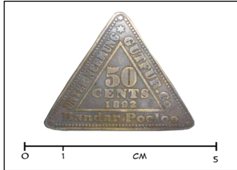
Gambar 5.4: Contoh uang kebon 4 (Churmatin Nasoichah, 2010)

Uang ini berbentuk segitiga sama sisi dengan ujung membulat yang memiliki panjang pada masing-masing sisi 4,1 cm dan tebal 0,1 cm. Pada bagian tepi uang ini berdekorasi deretan bulatan-bulatan kecil yang berujung bintang pada masing-masing ujung segitiganya. Uang ini berbahan perunggu. Mata uang ini hanya terdapat satu sisi saja yang bertulisan, sedangkan sisi lainnya kosong. Adapun tulisan yang dimaksud adalah Unternehmung Gur Für. Co Bandar Poeloe yang berada pada tepinya sedangkan pada bagian dalam yang dibatasi oleh garis tipis menonjol bertulisan 50 pada bagian atas, Cents, pada bagian tengah, dan 1892 pada bagian bawah.