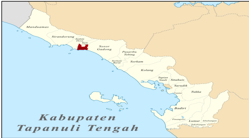
Gambar 4.1 Lokasi Barus

Barus yang memiliki letak geografis yang strategis, membuat Kota Barus menjadi pelabuhan yang ramai, menjadi tempat persinggahan saudagar-saudagar muslim Arab dan menjadi salah satu pusat perniagaan pada masa dahulu, sebelum masuk agama Islam ke Barus, masyarakat setempat telah menganut agama Hindu. Hal ini dibuktikan dengan orang Arab telah diangkat mengepalai orang-orang Muslim di Ta Shih. Pada abad ke-7 dan 8 M sudah ramai didatangi para saudagar dari negeri Arab, Persia dan India.