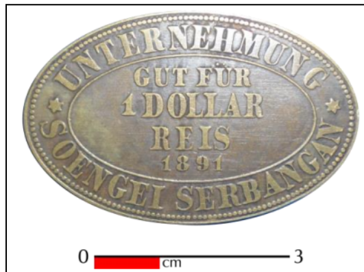
Gambar 5.5: Contoh uang kebon 5 (Churmatin Nasoichah, 2010)

Uang ini berbentuk segitiga sama sisi dengan ujung membulat yang memiliki panjang pada masing-masing sisi 4,1 cm dan tebal 0,1 cm. Pada bagian tepi uang ini berdekorasi deretan bulatan-bulatan kecil yang berujung bintang pada masing-masing ujung segitiganya. Uang ini berbahan perunggu. Mata uang ini hanya terdapat satu sisi saja yang bertulisan, sedangkan sisi lainnya kosong. Adapun tulisan yang dimaksud adalah Unternehmung Gur Für. Co Bandar Poeloe yang berada pada tepinya sedangkan pada bagian dalam yang dibatasi oleh garis tipis menonjol bertulisan 50 pada bagian atas, Cents, pada bagian tengah, dan 1892 pada bagian bawah.