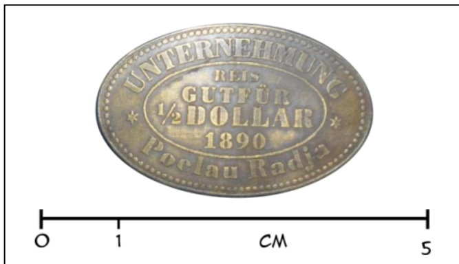
Gambar 5.3: Contoh uang kebon 3 (Churmatin Nasoichah, 2010)

Adapun pada bagian sisi yang lain terdapat tulisan dalam aksara cina dan terdapat motif garis-garis kecil di bagian tepiannya.